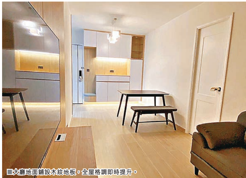
■大廳地面鋪設木紋地板，全屋格調即時提升。