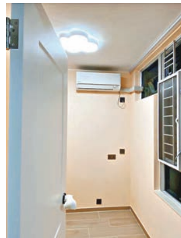
■小睡房預留充足電位。