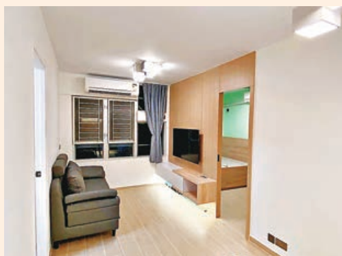
■飯廳與主人房由一道暗門分隔。