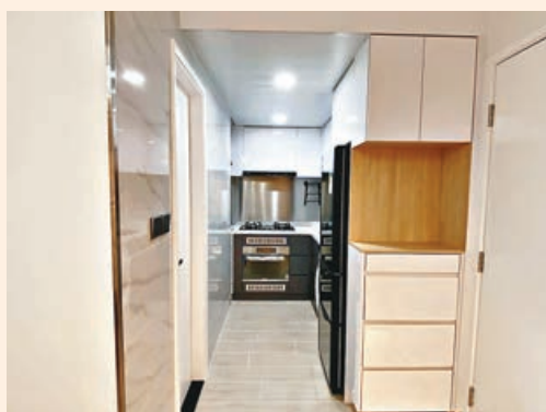
■開放式廚房入口處，設置了高身儲物櫃。