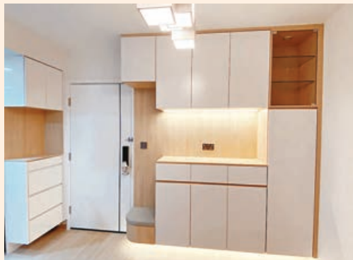
■大門口旁訂造了C字儲物櫃，提供收納空間。