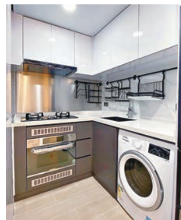
■開放式廚房配置淺白色吊櫃。