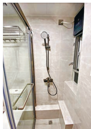
■廁所全新改造，淋浴位置改裝成企缸及趟門。