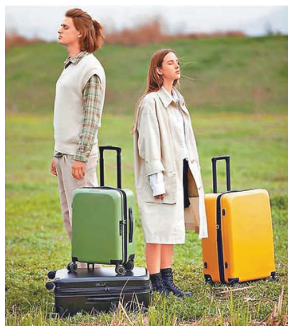
■維麗杰旅行箱散發青春氣息。