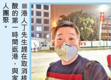
■港人丁先生趕在取消核酸的第一時間返港，與家人團聚。