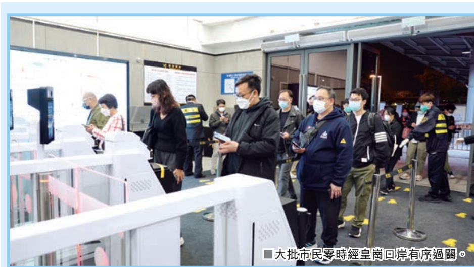
■大批市民零時經皇崗口岸有序過關。

作為深港之間唯一一個客貨運均實行24小時通關的陸路口岸，皇崗口岸從今日零時起將全面恢復旅檢通關。據皇崗出境邊防檢查站相關負責人介紹，目前，皇