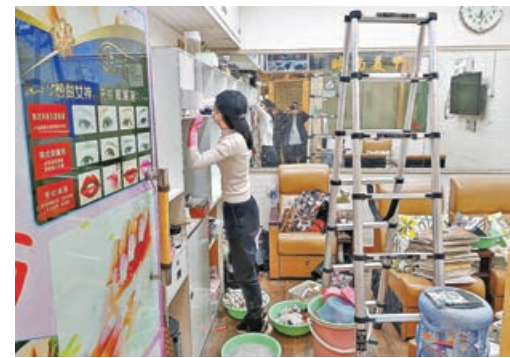
■羅湖商業城一美甲商舖負責人表示，已有香港顧客預約今日上門消費。

為確保深港陸路口岸全面恢復通關，深鐵集團也針對重點車站制定了全方位的運營保障計劃。在客運服務方面，銜接各陸路口岸的地鐵車站將加強現場客運力量投入，確保鐵馬、廣播、導向標識等充足到位。在運輸組織及出行保障方面，實時監測各線路車站的客流情況，靈活調整備用車上線。重點車站也將加強對攜帶大件行李乘客的安全保障。