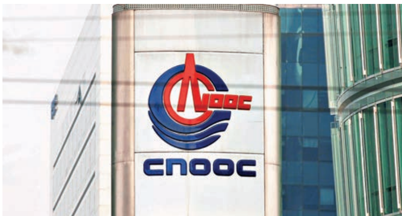
■ 港股通雖錄得大額淨走，但中海油仍獲淨買逾2億元。

中短期圖表技術支持位，則仍見於19,600點至20,800點區間。操作上，在市況恢復穩定性之前，建議要注意追高風險，目前宜以候低吸納，在等候的同時，可以先選好優質吸納名單，機會都