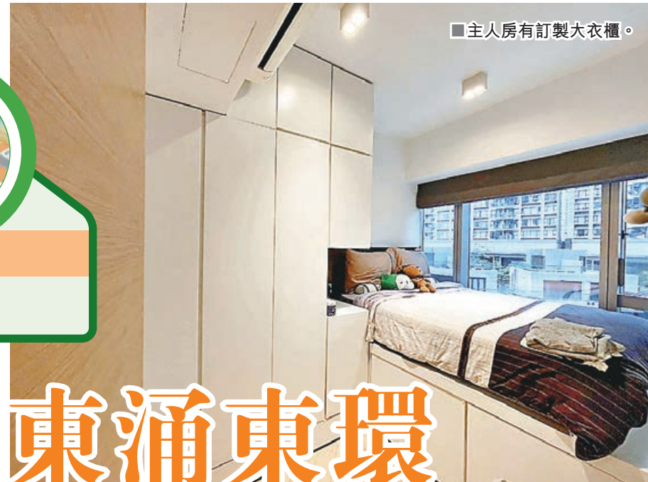
主人房有訂製大衣櫃。