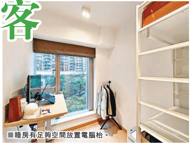
睡房有足夠空間放置電腦枱。

東環會所佔地約19萬平方呎，分為兩部分。Club Century位於第2座和第6座基座，設施包括24小時開放健身室，內設拳擊擂台、健身單車機、跑步機等設備。而佔地6,000平方呎的天際會所Sky Link位於第2座頂層(28及29樓)，可享機場海景及飛機升降景。