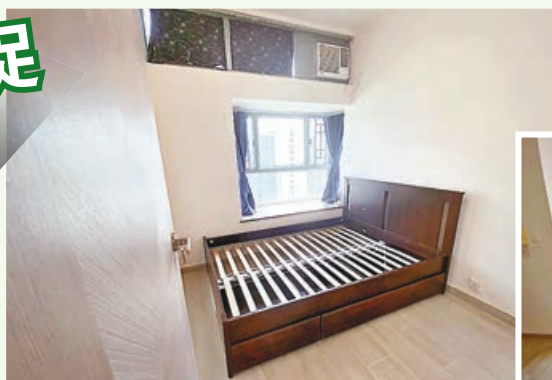
主人房夠大，可放置大床。