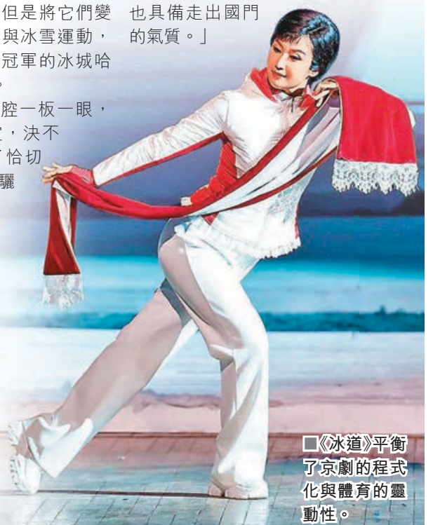
■《冰道》平衡了京劇的程式化與體育的靈動性。