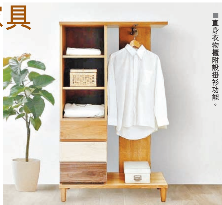
■直身衣物櫃附設掛衫功能。

丸吉民藝傢具是一家位於日本九州福岡縣大川市的傢具製造商。工匠們保留傳統，採用新工藝，重視木材的溫暖和質感，用手工精心製作一件件木製傢具。丸吉產品設計精美又實用，時尚直立企身衣櫃一邊為放置衣履的櫃桶和層架，包括3個櫃桶和3個層架，另一邊則用作懸掛西裝襯衫。