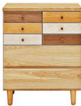
■日式手工木製衣物櫃，外形美觀。

丸吉民藝傢具另一款時尚設計為八桶衣櫃，上半部為左右並列兩排的6個櫃桶仔，下半部則為兩個大櫃桶，設計無論色彩和外觀感覺都十分優雅，實用又美觀。