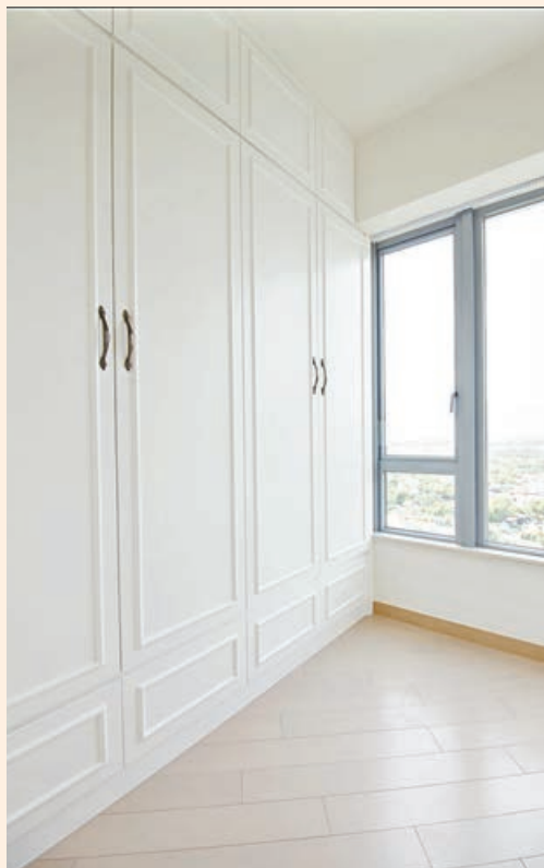
■睡房高身白色衣櫃，配以藍色窗框。