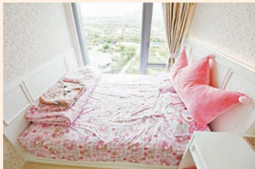
■主人睡房淺白配搭粉紅小磁花牆紙，散發出年輕女主人的少女氣息。