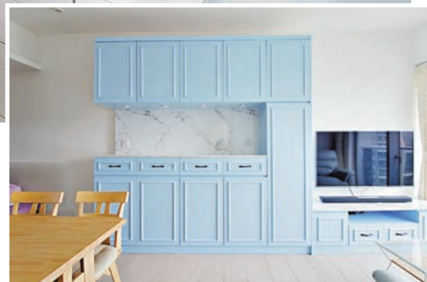
■大廳的藍色C字櫃十分搶眼。

設計師也發揮其巧思，將清新田園風格的傢俬用到底。兩間房雖然都用上同款歐式花線，但睡房改以白色作主色，務求將面積偏小的房間營造寬敞與舒適的生活空間。主人房牆身貼上小磁花牆紙，訂造不同類型的傢俬，既有實用性也為年輕女主人帶一點少女味。