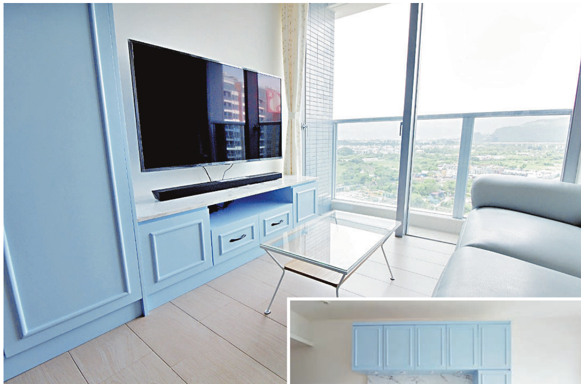
■客廳藍色主調，散發法式浪漫氣氛。