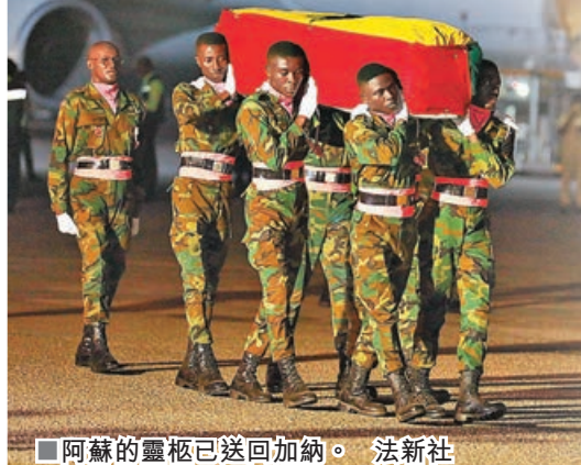
阿蘇的靈柩已送回加納。