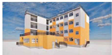
將於5月入伙的「雅匯」第二期構想圖。

請，申請者須為年滿18歲或以上香港居民；現居於劏房、寮屋、天台屋及其他環境惡劣居所或有迫切住屋需要；有全職工作或已申請綜合社會保障援助；有切實可行遷出計劃，並在兩年為上限的住宿期內遷出。甲類申請人並須輪候公屋最少3年，乙類申請人為輪候公屋不足3年或沒有輪候公屋而有迫切住屋需要的人士。兩個類別申請人均須通過聖雅各福群會社工面試評估及審批。