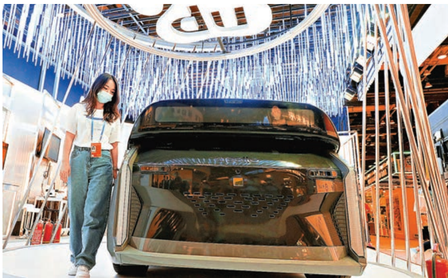
■ 百度將於本月中推出聊天機械人「文心一言」。

憧憬兩會提出金融經濟改革，招行(3968)升6.5%，建行(0939)漲2.9%；港交所(0388)漲5.1%；滙控(0005)及友邦(1299)分別升1.6%及2.7%。