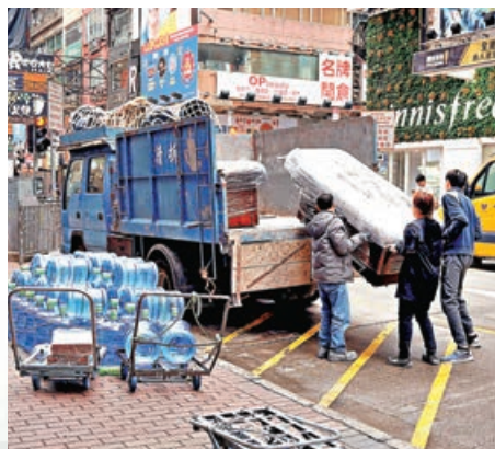
■ 貨車司機經常搬貨，或容易造成勞損。