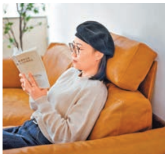
■靠着馬皮梳化的頭枕和靠背看書，倍覺舒適。

RIN梳化以飛驒高山著名的曲木技術製作，完美展示日本職人手藝。梳化以實木外框包圍，含有羽毛成分的內芯；柔軟而堅挺的梳化墊褥，坐下的時候有如溫柔地承托身軀。最特別的地方，凜系列梳化選擇了馬皮。馬皮的組織纖維既彈性又堅韌，毛孔更幼細，油潤度更高。而且每一幅馬皮尺寸不大，都十分珍貴。