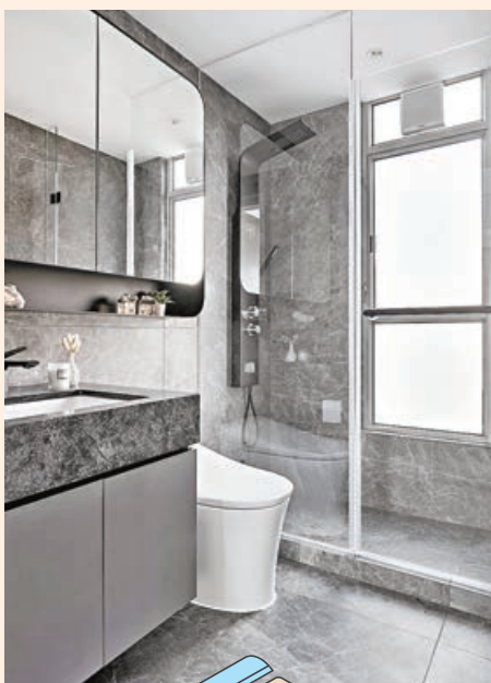
■浴室用上深灰色的雲石紋磁磚，帶來時尚感。