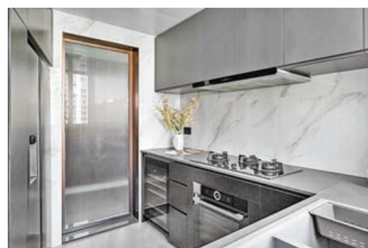
■廚房L形煮食爐和洗菜盆，方便女戶主大展廚藝。