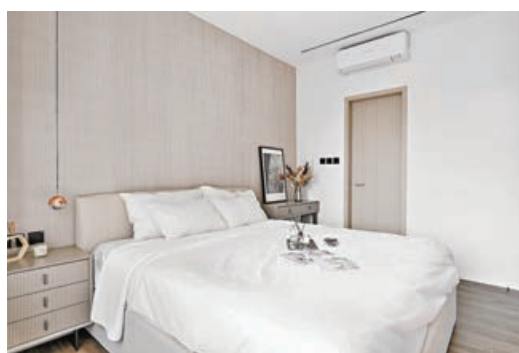
■主人房採用淺色明亮色系作主調。

實的客廳和走廊，彷彿穿過隧道進入到另一個空間，淺卡其色及淺木色的牆身給人一種光亮而又寧靜的感覺，讓戶主能夠釋放壓力，躺在床上舒適地進入夢鄉。