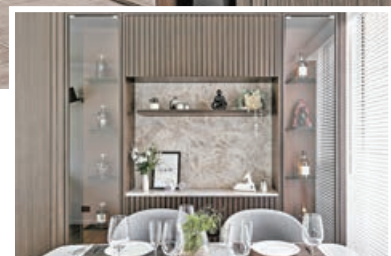
■酒櫃用上金屬片層架，輕盈的感覺加上背面的皮革飾面，達至高貴的感覺。

客廳的採光度很好，因此我們在電視櫃位置用上沉穩的深灰木，用暗門隱藏走廊再延伸到去酒櫃位置。梳化背的白牆以及白色天花將陽光反射到室內空間，因此即使用深木色仍然能夠保持光亮度，不會讓整個空間感到暗沉，反而有一種踏實的安全感，深沉色系亦能讓眼睛完全地達到放鬆的狀態。穿過沉