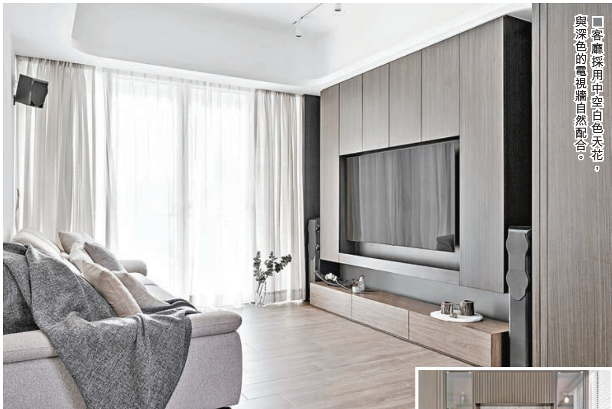
■客廳採用中空白色天花，與深色的電視牆自然配合。