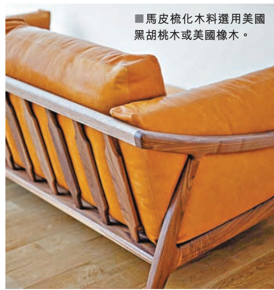
■馬皮梳化木料選用美國黑胡桃木或美國橡木。