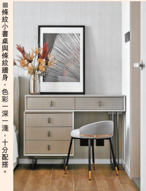
■條紋小書桌與條紋牆身，色彩一深一淺，十分配搭。