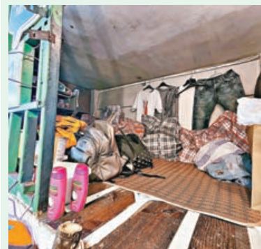
■「侷住體驗館」中閣仔房。