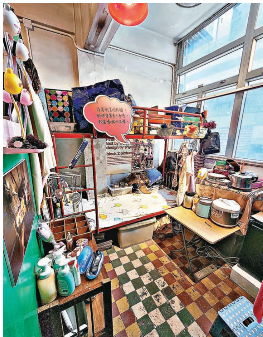
■展覽館1:1還原劏房、板間房及閣仔房等基層住屋實境。

住屋問題困擾香港多年，不少基層居住在環境惡劣的劏房，甚至面對滲水、電線外露、蟲鼠蟻橫行等問題，但究竟情況有幾差，可能需要實地參觀才能領略箇中感受。社區組織協會在大角咀一個唐樓單位設置「侷住體驗館」，1:1還原劏房、板間房及閣仔房等住屋實境，並保留部分裝修，邀公眾親身體驗基層住戶情況，由無家者及住不適切居所的街坊化身導賞員，並經前線社工帶領一起討論扶貧及房屋政策，盼凝聚大眾了解基層生活實況，讓社會消除貧困歧視。