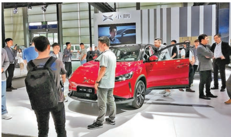
造車新勢力受北水青睞。

港股上周五(10日)走了一波四連跌，並出現放量加速態勢。恒指收跌超過600點，跌破2022年底的19,781點年內低位，大市成交金額增至逾1,600億元，是今年2月以來最大單日成交金額。港股弱勢盤面正在深化，惟這一波跌勢仍是預期範圍之內。