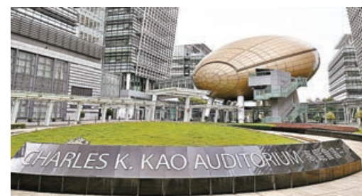
內地和香港正推動科技資源共享，促進香港創新科技發展。圖為香港科學園。資料圖片

工聯會促請政府全面檢討及完善人力資源規劃，推動人手相對緊張的行業優先提高薪酬待遇，改善工作條件並加強勞工保障，包括加強職業安全、減少工作時間及減低高強度勞動等。