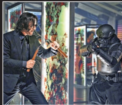
■《殺神John Wick 4》打鬥場面非常精彩。