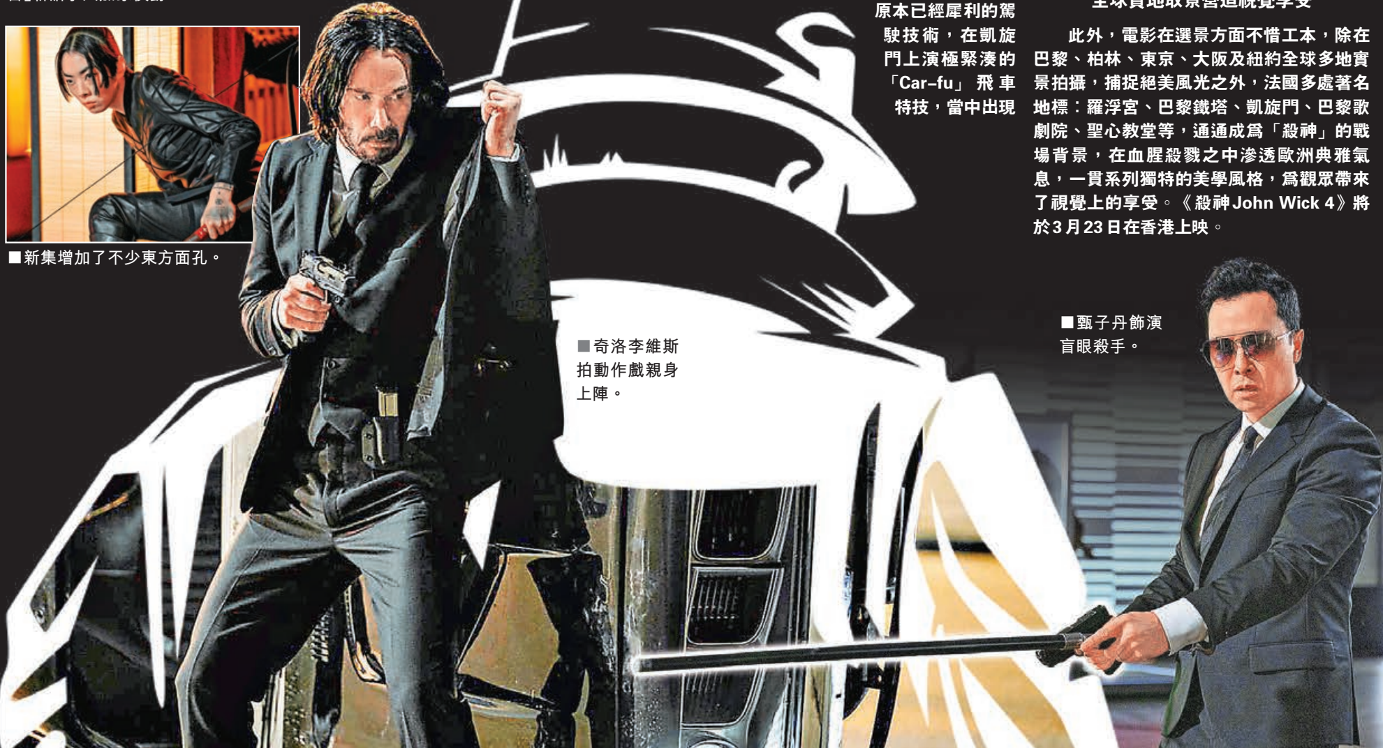
■甄子丹飾演盲眼殺手。