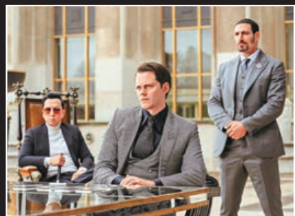
■標斯卡斯格(中)飾演殺手集團「高桌會」新話事人加蒙侯爵。