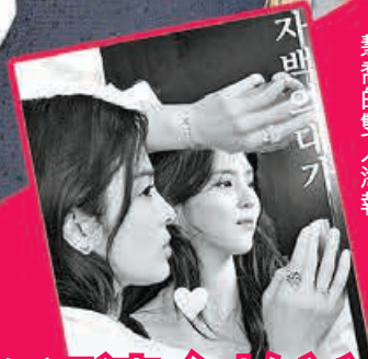
韓韶禧於 Instagram 分享與宋慧喬的雙人海報。