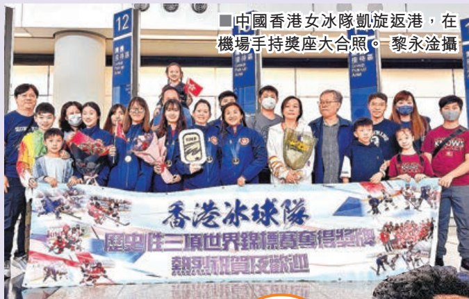
中國香港女冰球隊凱旋返港，在機場手持獎座大合照。