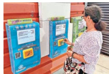
■ 市民可於港鐵車站用八達通領取消費券。

八達通餘額為0元，而尚未領取交通津貼為250元，系統會將派發全額的交通津貼到你的八達通，以及把2,750元的消費券儲入八達通，屆時八達通則會有合共3,000元的儲值，而剩餘的250元消費券將要留待八達通有金額「空間」，