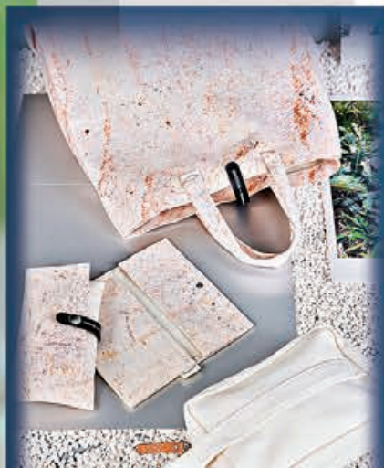
■ 各大商場推出不同優惠刺激市民購物慾。