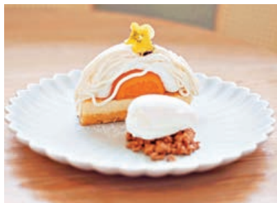
■ KoBaNe by Minimal 咖啡店的精緻甜品。