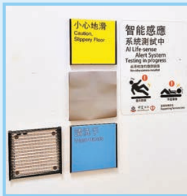
■ 醫管局開始在部分急症室無障礙洗手間試行安裝感應系統。