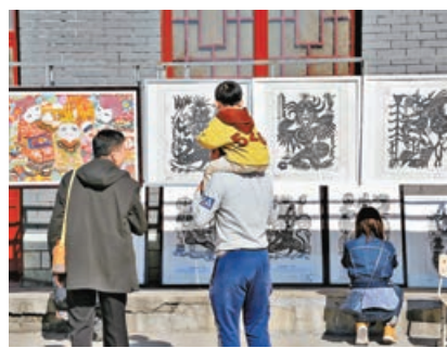
■關雲德剪紙是遊客們最喜愛的展品之一。