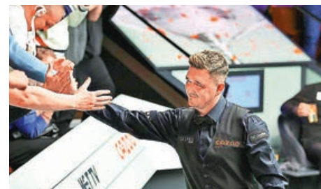
■加蘭威爾遜與球迷擊掌慶祝。

最終以10:5淘汰賴恩戴爾的加蘭威爾遜賽後表示：「打出147真係難以置信，我通常都好冷靜同低調，但今日我真係好興奮，能夠成為桌球歷史一部分真係冇得彈，呢樣係有錢都買唔到，當我老咗再回憶睇番，肯定係個偉大成就。」世界排名第7的他，下圈將會硬撼4屆世界冠軍希堅斯。