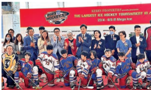
■冰球記招場面相當熱鬧。

「Mega Ice 五人冰球賽」自2012年以來一直被認為「香港品牌」活動之一，今年亦繼續獲肯定為亞洲最大型冰球賽，今屆青少年組比賽將於本月23日至29日舉行，成年組則於5月1日至5月6日上演。其中在男子成人組，多支家傳戶曉的队伍如 Sammi's Superstars、HKIHA、Gold Club、Kung Pow Kings、HK Tigers 和 Tokyo Mavericks 已磨拳擦掌。至於本地女子冰球好手將有3隊參戰，包括WIHO