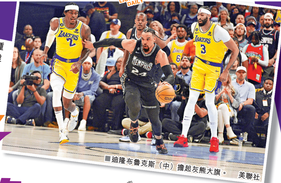
■迪隆布魯克斯（中）擔起灰熊大旗。