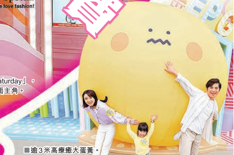
■逾3米高療癒大蛋黃。