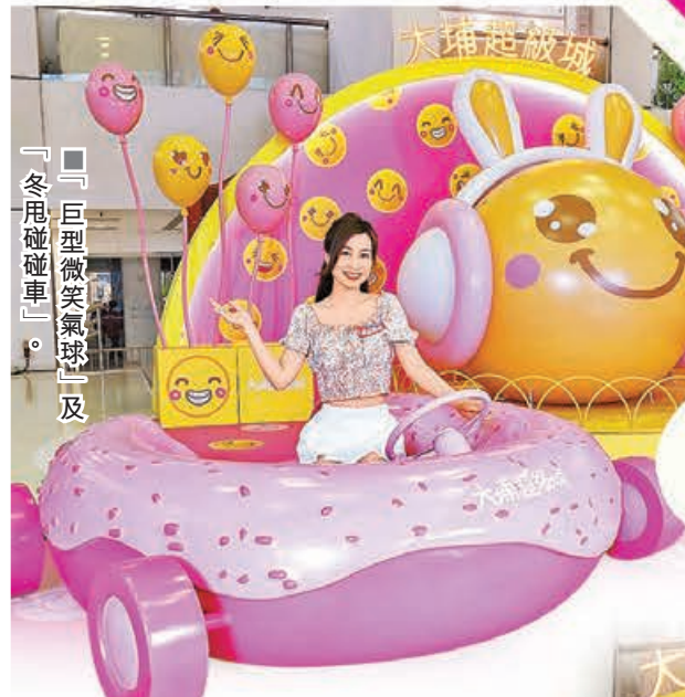
「巨型微笑氣球」及「冬甩碰碰車」。

春意盎然，最適合相約三兩知己享受消遣及購物樂趣，兼為衣櫃添上春夏氣息。適逢新一期政府消費券於早前派發，不少商場為讓市民盡情賺取最多「着數」，趁機推出一連串消費賞活動，幫助大家把消費券自行「增值」。同時，為迎接重現開心笑臉的春日，多個商場亦在今個月特別布置色彩繽紛的趣致裝置，務求吸引親子來打卡玩樂，順道於商場消費。