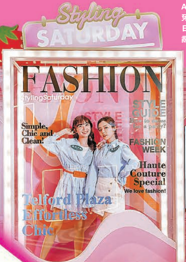
■走進「Styling Saturday」，成為潮流雜誌封面主角。

在舉行購物節的同時，在商場1期地下中庭更布置了一系列以「Always Make Your Day」為主題的趣拍裝置，將一星期七天分別配上不同場景，化身為七個「吸睛」打卡位，包括以色彩繽紛的甜