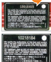
■上方正品的保證卡沒有雷射效果。 ■正品的肩帶縫合乾淨利落。

CHANEL手袋附贈保證卡。保證卡上有一行序列號，這行序列號有凹凸感，如果是平的就是假的。正品的保證卡就像信用卡一樣堅硬，不容易彎折，且沒有雷射效果。部分假保證卡則做出了雷射效果。真假保證卡的字體、字的大小、顏色、間距都是有差別的。