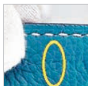
■Hermès包上都標記了製造年份。

Hermès包上都標記了製造年份，刻在扣包的帶子上，包正面右邊那條金屬扣的背面，凹下去的正方形框內的英文字母，表示年份。Constance包的刻印位置，凹印的代碼將藏在內部的側邊上角，靠近縫線。