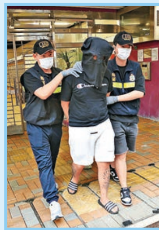
海關在蘇屋邨反毒品行動中拘捕一名 24 歲無業男子。

今年 2 月 1 日，CBD（大麻二酚）已在本港被列為毒品。為配合本月「反大麻月」宣傳及執法，提高市民尤其是青少年的防毒意識，警方由 3 月 19 日至 4 月 23 日進行代號為「沙鷗」行動，打擊製造和社交平台銷售大麻的犯罪活動，成功偵破 33 宗毒品案，包括在葵涌破獲 3 個大麻種植場和在新田破獲一個大麻儲存倉及分銷中心。行動檢獲各式毒品，包括含 CBD 及 THC（四氫大麻酚）產品，總值約 4,200 萬元，拘捕包括 3 名學生在內的 82 人，年齡最小的為一名 15 歲已輟學男童。