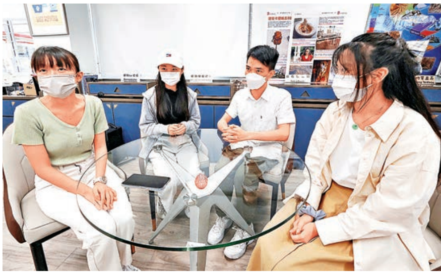
■幾位受訪考生都認為，昨日文憑試中文科卷一難度比往年較低。

逾4萬名考生昨應考中學文憑試中文科閱讀及寫作卷，今年閱讀卷指定文言文篇章題目主要考學生詞解及背誦，內容較簡單直接；不過白話文篇章文學性較高，哲理性較強，其中一篇通過山與水對話探討生死之間的領悟，對考生的理解與感悟較具挑戰性。至於寫作卷三選一考題，題材與個人及社會關係緊密。多名考生及教師普遍認為整體難度較往年低，有資深中文科主任指今年題目雖簡單，但對於文字表達和理解、答案完整性有要求，想拿高分需仔細歸納和總結文章和核心思想。