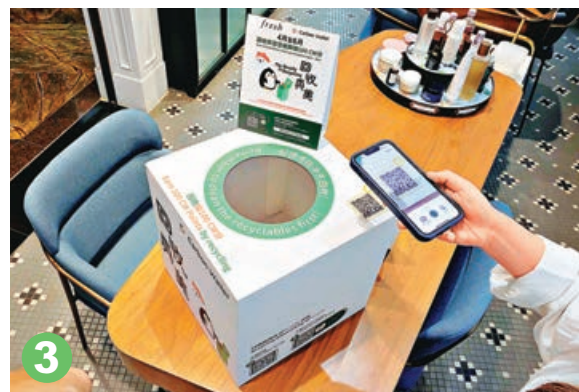
3 第三步掃描二維碼以獲取特別獎賞。

港鐵子公司MTR Lab旗下的減碳獎賞平台Carbon Wallet公布，為響應4月22日世界地球日，與六個美容護膚品牌合作，推出美容空瓶回收計劃「回收真美」，合作品牌的60多家分店屆時設有回收箱接收任何牌子的美容空瓶，參與人士可賺取100CW積分，以換取折扣優惠或禮品，甚至可獲得免費港鐵車程。