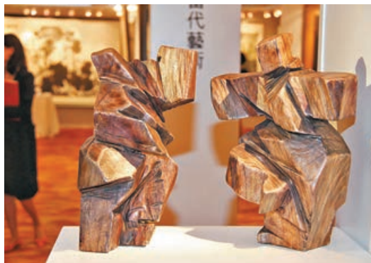
■朱銘的太極雕刻2014年曾在港拍賣。