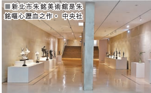
■新北市朱銘美術館是朱銘嘔心瀝血之作。

主題。如果我的主題是情慾，也要娶很多老婆。」他笑說，「畢加索很偉大，但他跟我沒有關係。」所以一路學雕塑，也一路在丟棄，丟棄別人的影子，騰出空間，讓自己的思想壯大。他也丟老師的影子，丟了李金川後，丟楊英風，然後連自己的也丟，丟民間雕刻，丟太極……這才有空間創新。