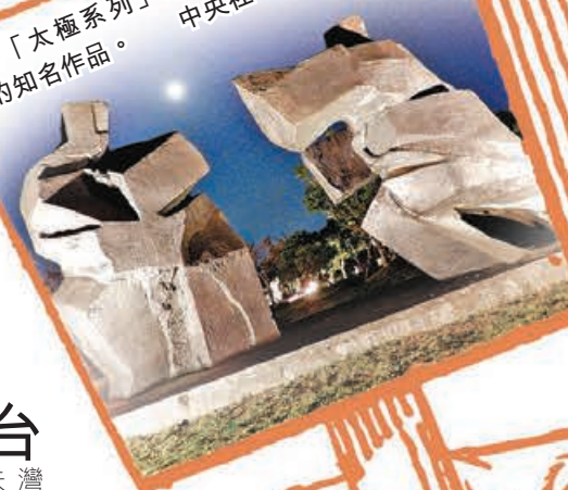
■「太極系列」是朱銘的知名作品。