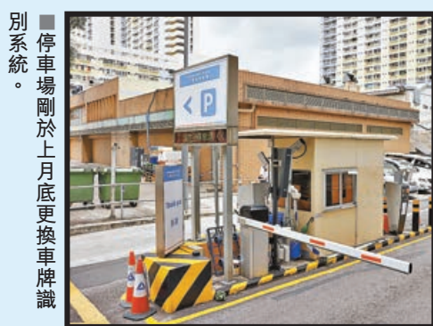
停車場剛於上月底更換車牌識別系統。