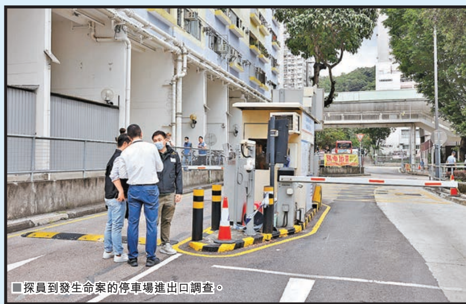
探員到發生命案的停車場進出口調查。

沙田警區刑事部警司黃慧賢表示，探員在調查期間，另在涉案男司機的私家車內檢獲約2克大麻，遂以涉嫌「誤殺」及「藏有危險藥物」罪將其拘捕。稍後將為死者安排驗屍以確定死因，以及翻查停車場的閉路電