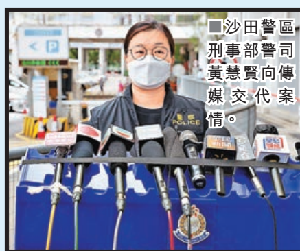
沙田警區刑事部警司黃慧賢向傳媒交代案情。

視調查案件詳情，包括有否涉及打鬥情況等。警方呼籲任何人如目擊本案發生或有資料提供，可致電3661 2758與調查人員聯絡。