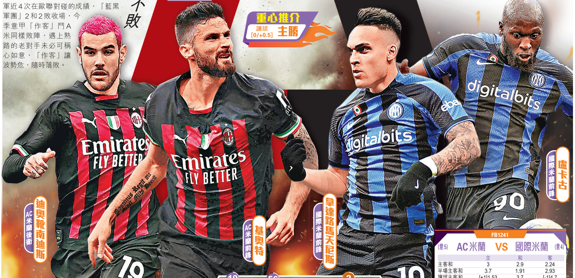
迪奧靴南迪斯 AC米蘭後衛