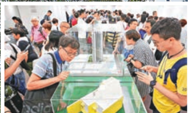
大量市民住屋需求殷切。