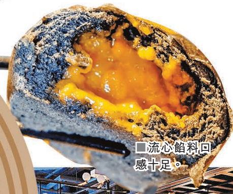
■ 流心餡料回感十足。

將軍澳點粵推出超值點心放題優惠方案，放題的菜式種類豐富，亦有甜點美食可選擇，加上點粵的環境優雅，帶長輩來聚餐都不會失禮。100分鐘內可任食粵蝦餃皇、羊肚菌燒賣皇后、黑金流沙包等多種款式高級點心。由即日起至8月31日限時內透過TapNow購買，更可以享受獨家的199元買1送1優惠（必須至少1天前致電2861 1226預約，須註明使用TapNow優惠），人均低至100元。購買四位以上，每位更會額外送鮮芒果爆爆布甸杯（價值48元），客人亦可以多加每位10元嘆無限任飲汽水。