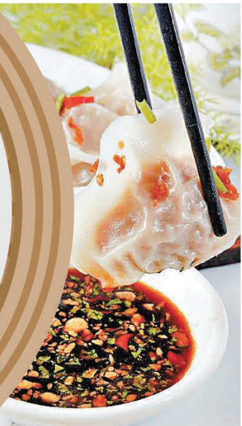
■ 京川滑餃子沾蒜泥香醋吃特別滋味。

新鮮感美食包括蟲草花濃湯鮮竹卷、千層飄香榴槤酥、洪湖桂花糯米藕等。御名園分店包括香港仔利東商場店、大角咀新九龍廣場店、荔枝角AEON店、荃灣千色滙店、將軍澳天晉店、元朗鴻運中心店。