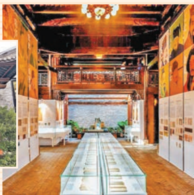
■ 二十四史書院內藏眾多中國經典歷史名作。