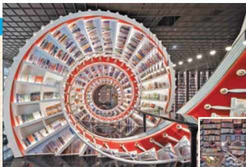
■ 紅色巨型螺旋書架向深圳歷史與成就致敬。 X+LIVING