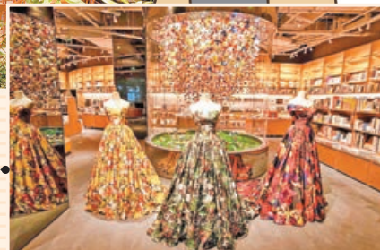
■ 蔦屋書店一入門便能看到日本女攝影師、導演蜷川實花的婚紗作品。