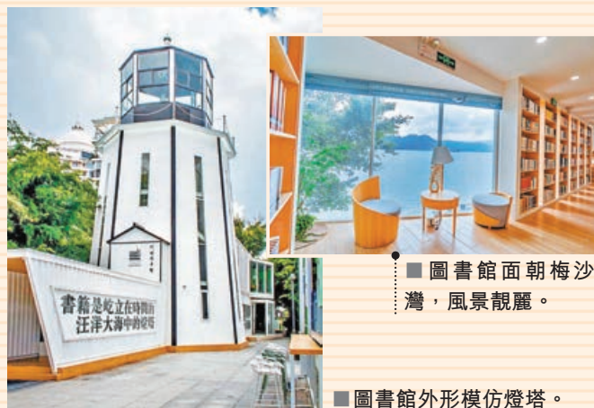
■ 圖書館面朝梅沙灣，風景靚麗。