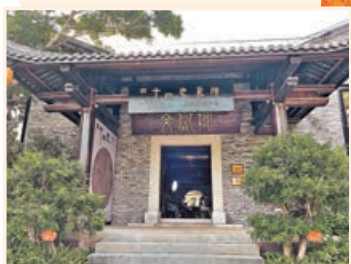
■ 二十四史書院文獻樓。

久在浮躁的都市生活，沉下心來閱讀成為難得可貴的一件事。當書店融入藝術型格設計和人性化服務設施，會不會讓你更有意慾「打書釘」？作為急速發展的國際都市，深圳擁有廣東省最多的實體書店，匯聚中國境內乃至全球最好的特色書店品牌，定讓你手不釋卷。