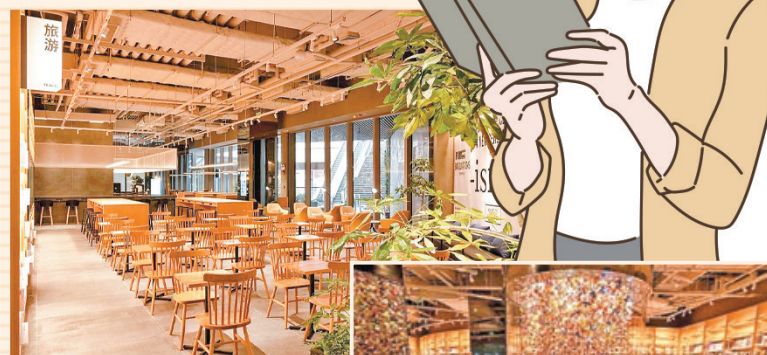
■ 蔦屋書店首推「咖啡+書店」模式，吸引年輕客戶。