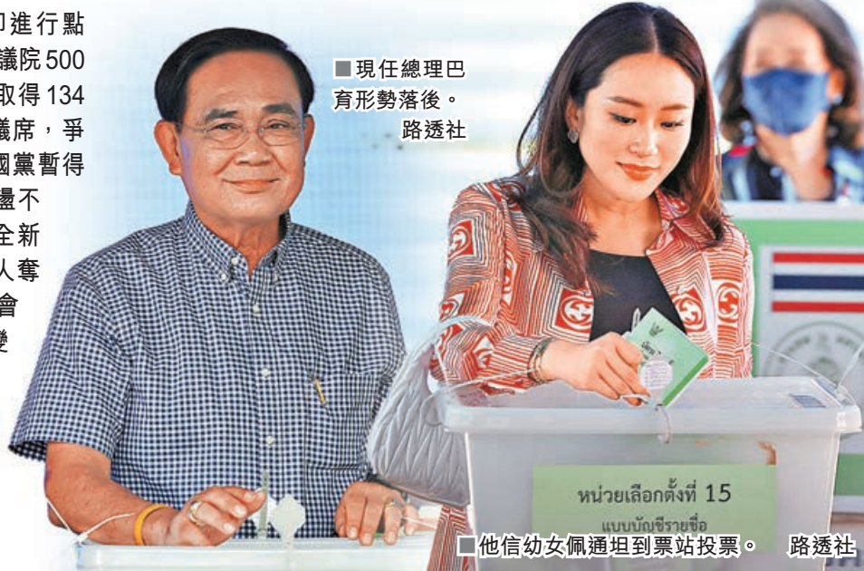
■現任總理巴育形勢落後。

泰國國會大選昨日結束投票，隨即進行點票。截至香港時間昨晚10時30分，在下議院500席中，在野的為泰黨和前進黨暫時分別取得134席及122席，在野黨已奪得下議院過半議席，爭取連任的總理巴育所屬的泰國人團結建國黨暫得40席排第四。泰國政壇過去數十年間動盪不斷，政治學家普遍指出，泰國社會需要全新的社會契約，逐步改變部分人群默許軍人奪權的看法，建立政黨政治的傳統，讓社會運作更加有序，才能長遠擺脫選舉與政變交替的漩渦。