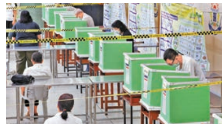
■泰國民眾投票選出他們心目中的領導人。

納隆攀將在今年9月30日卸任，記者進一步追問他，能否確認在其擔任陸軍總司令期間，軍人不會發動政變，納隆攀說，「我無法確定國家會否和平，和平只能通過大家共同努力來實現。但我可以向你保證，過去發生的事情（政變），現在重演的機會是零。」新加坡《聯合早報》指出，納隆攀此番談話有助緩和人們對民主派勝選後，軍方可能再度干政的擔憂。政治觀察員認為，泰國大選不論是自由民主派或保守派執政，泰國接下來的6個月至1年內，應不會發生政變推翻民選政府或反對派大規模上街示威抗議的情況。