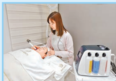
美容師為顧客做皮膚護理。