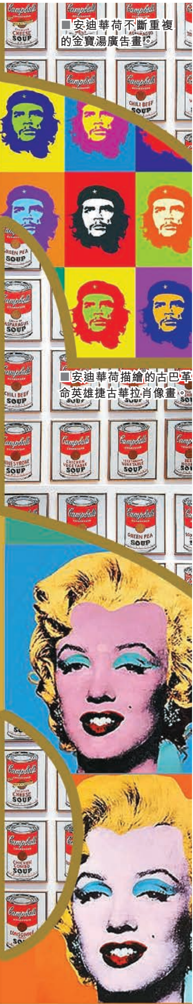
■安迪華荷不斷重複的金寶湯廣告畫。