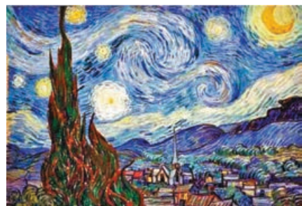
■後印象派大師梵高的名畫：《星空》。

後印象派是從印象派發展而來。在作畫時以表現個人對對象的思想情緒為主，趨向主觀的抒情表現，嘗試對色彩及形體表現性因素的自覺運用，不顧及任何題材和內容，轉向更高的對形式結構、色彩和線條的情感表現，側重於表現物質的具體性、穩定性和內在結構。後印象派代表畫家包括莫迪利阿尼、羅特列克、西涅克、梵高等。