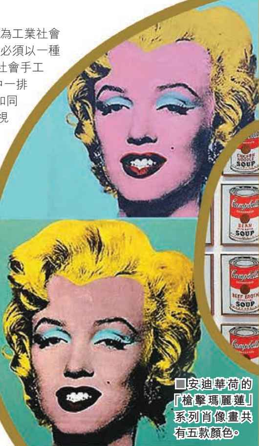
■安迪華荷的「槍擊瑪麗蓮」系列肖像畫共有五款顏色。

後印象派是從印象派發展而來。在作畫時以表現個人對對象的思想情緒為主，趨向主觀的抒情表現，嘗試對色彩及形體表現性因素的自覺運用，不顧及任何題材和內容，轉向更高的對形式結構、色彩和線條的情感表現，側重於表現物質的具體性、穩定性和內在結構。後印象派代表畫家包括莫迪利阿尼、羅特列克、西涅克、梵高等。