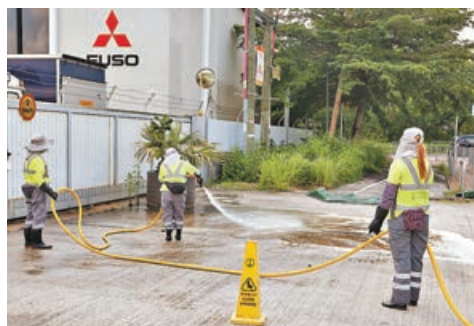
食環署人員清理現場血漬。

「球叔」對妻子遭遇不測深感痛心，「我哋家庭係好和諧，發生啲咁嘅(事)，當然係好不幸，好痛苦啦。」又慨嘆道：「兩個一齊(散步)都冇事嘅，我行第一，佢行第二，(分開)咁就出事喇。」