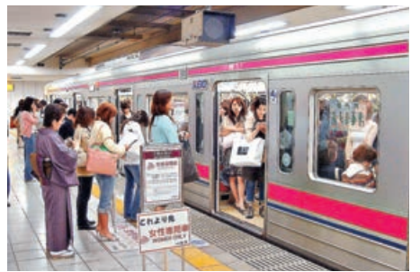
■ 女性專用車廂在繁忙時間設立。

日本大眾運輸工具設有只有女性才能搭乘的「女性專用車」。電車的「在來線」等列車、巴士與計程車皆有女性專用車。此舉是為了防範癡漢性騷擾而實行的制度，早晚的尖峰時段會依照車廂、時段與列車將部分車廂或車輛改為女性專用。雖然法律上沒有禁止男性搭乘，但男性乘車則是違反禮儀的一種。國小生以下的孩童、身障者與其同行者不論男女都能搭乘女性專用車。