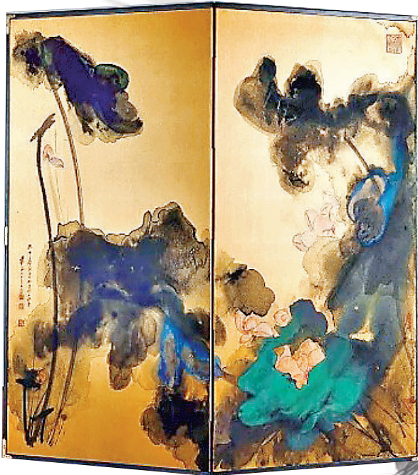
張大千《花開十丈影參差》雙折屏風。 資料圖片

若再追溯遠些，2011年5月蘇富比香港舉行「梅雲堂藏張大千畫」專場拍賣，25幅張大千重要畫作在15小時內全數賣出，總成交價為6.8億港元（包括買家佣金），其中一幅《嘉藕圖》更以1.91億港元成交。