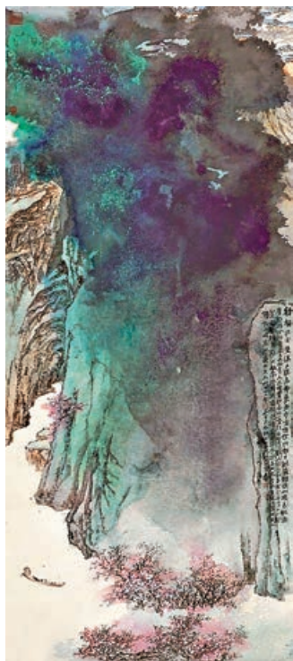
《桃源圖》拍賣價高達2.7億港元。 資料圖片

張大千一生四海為家，其作品《春雲曉靄》，30年前以大約200萬港元成交；30年後，升值逾100倍，成為歷來第五貴的張大千作品。