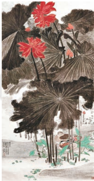
張大千《嘉藕圖》2011年以1.91億港元拍出。

張大千早年從仿古入手，青藤八大，盡攝神殿；西浸敦煌後線力量大進，工筆繪荷越見嫻熟；中年偏向大寫意，複合潑墨潑彩技法，宅有形於無形，「直到古人不到處」。