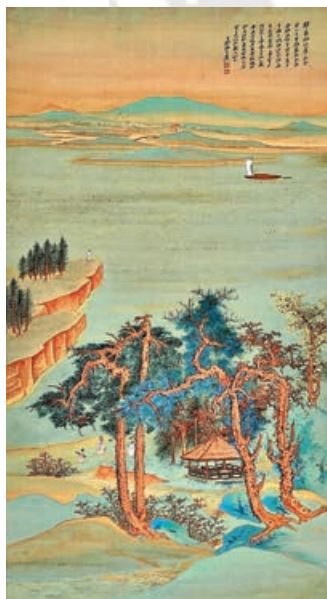
《仿王希孟千里江山圖》以3.7億港元天價成交。