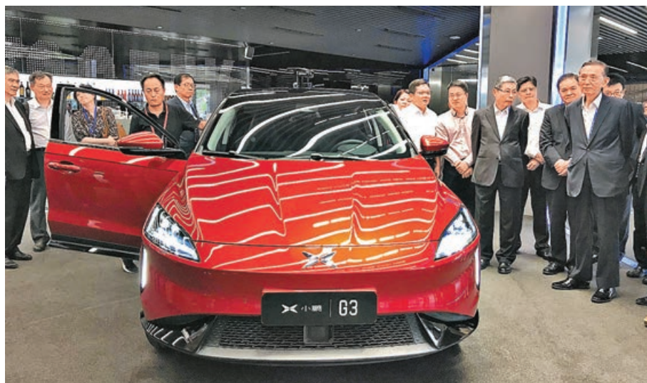
車股受捧，小鵬汽車獲北水淨買。

香港昨天繼續縮量窄幅震動，仍處於短期十字路口，但相信已到了方向選擇的關鍵時刻。恒指收市微升不足20點，依然受制於首個反彈阻力位19,500點以下，但仍企在18,800點好淡分水線之上。