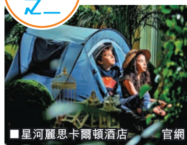
星河麗思卡爾頓酒店