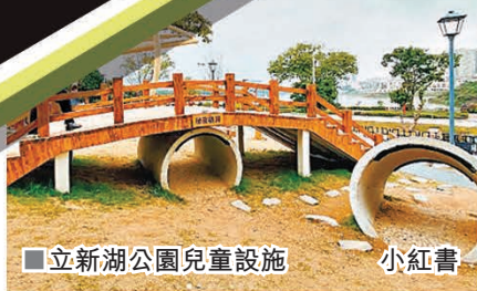
立新湖公園兒童設施