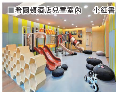
希爾頓酒店兒童室內

查詢方式：(+86) 0755-21628888 / https://bit.ly/41rlmJH