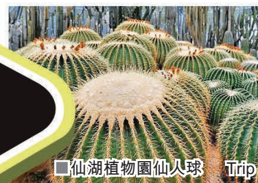
仙湖植物園仙人掌