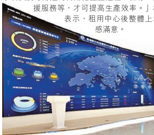
AMC成功吸引從事衛星製造的企業進駐。

AMC總樓面面積達110萬平方呎，樓高8層、每層樓底高達6米，柱間距離有12米乘12米，每平方米樓面承重達1.5噸，其他配套包括三相工業用電、24小時冷凍水、危險品倉庫等。