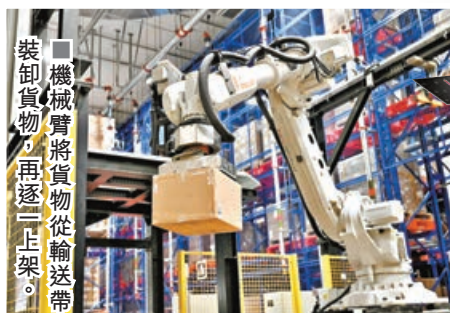
機械臂將貨物從輸送帶裝卸貨物，再逐一上架。

為支援本港創新工業發展及協助傳統產業升級轉型，位於將軍澳創新園的先進製造業中心(AMC)已啟用一年多。政府表示，中心至今成功吸引從事納米材料、電子半導體組裝、醫療設備等企業進駐，而香港首間以星系工程和衛星精密製造為核心業務的航天科技公司，同樣選擇落戶於此，設立約2萬平方米廠房。施政報告早前亦提出，研究在大埔創新園興建第二個AMC，科技園公司正進行可行性研究，為推動新型工業化及早部署，提供更多先進製造空間。