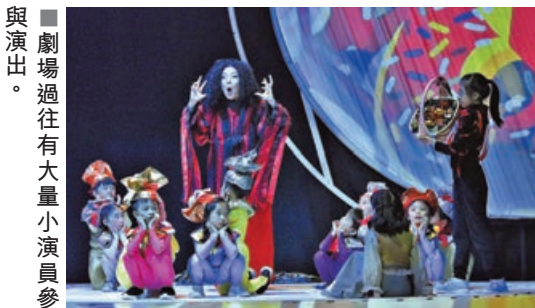
■劇場過往有大量小演員參與演出。

學院早前正式公布本年度合家歡兒童劇場企劃，並已在4月份進行公開遴選，限定取錄200名4至15歲小朋友，進行三個季度的綜合演藝訓練，透過戲劇、舞蹈、唱歌及演說，來訓練小朋友的表達能力、肢體協調、咬字呼吸，以及控制情緒等技能。一眾小演員將於兒童劇場《品格英雄》中，展現努力訓練的成果。