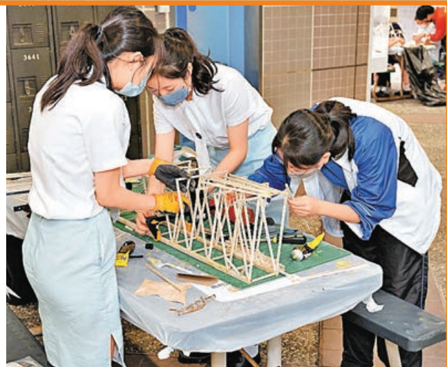
■巾幗不讓鬚眉，女同學努力製作木製模型。

基建工程是香港重要產業之一，不得不提起魯班先師，他是中國古代最傑出的工匠及發明家之一，被建造業界奉為師祖。適逢「魯班先師寶誕」將至，香港專業教育學院工程學科、香港建造商會等早前合辦第17屆「中學基建模型創作比賽」，弘揚「百匠之師」追求卓越工藝和勇於創新求變的精神，最終獲選組別可晉身7月8日，於香港專業教育學院（青衣）舉行的「橋樑模型靜力荷載抗壓測試」。