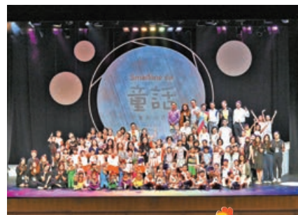
■主辦單位過去也有舉辦兒童劇場。