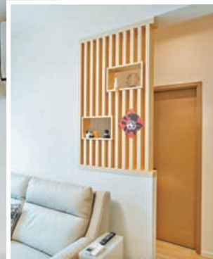
■ 梳化背後特設木條子屏風。