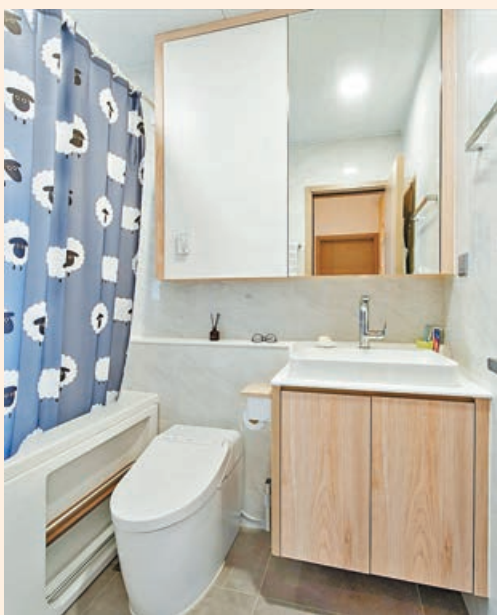
■ 廁所設計主要營造一種明亮、清新的氛圍。