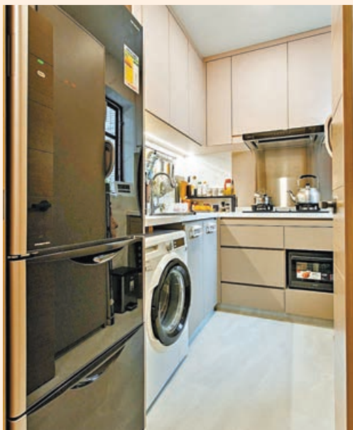
■ 廚房為求簡潔實用，採用了不銹鋼或黑色金屬的廚櫃和電器。