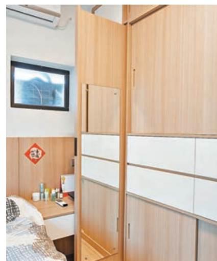
■ 房間採用北歐風的木色傢具。

北歐風格的廁所通常採用淺色調和簡單的設計，以營造一種明亮、清新的氛圍。簡單的白色瓷磚、淺色的木製地板和淺色的櫥櫃是常見的選擇。