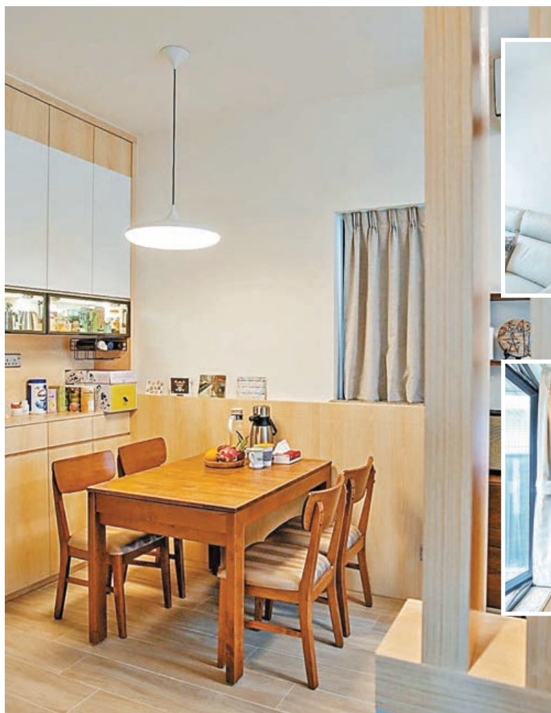
■ 飯廳一角，深色木餐枱與淺色木圍牆，相映成趣。