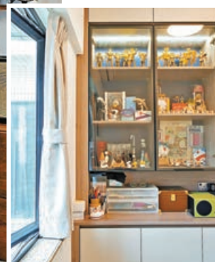
■ 度身設計的玻璃裝飾櫃，可安放屋主的收藏。