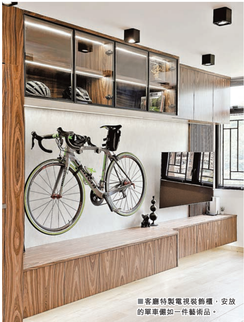
■ 客廳特製電視裝飾櫃，安放的單車儼如一件藝術品。