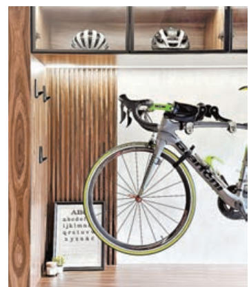
■ 戶主要求客廳要展示他的心愛單車及裝飾配件。