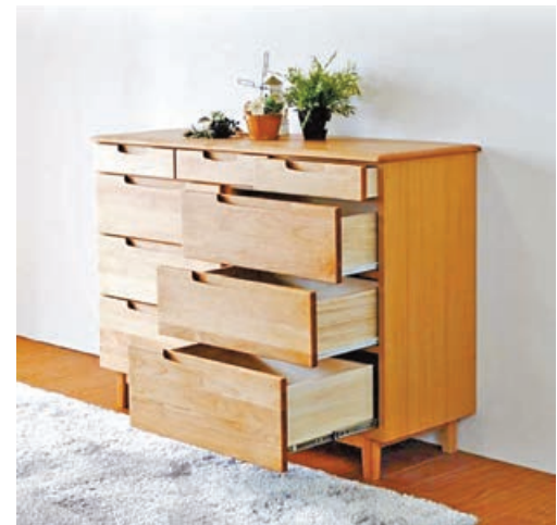
■ 日本儲物櫃，主打收納空間多。

ERIS 120 LC-4 圓角簡潔的設計，設有9個特大的木櫃桶，收納空間十足，櫃桶內還用左桐木製作可防止物品受到濕氣影響。而且設有櫃腳，使櫃的高度提升外還方便清潔。