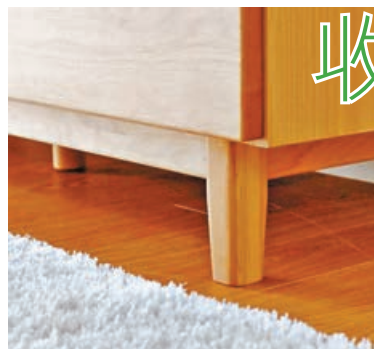
■ 儲物櫃特設櫃腳，以防物品受濕氣影響。

日本一生紀傢俬(Isseiki Furniture)主打簡約實惠傢具，今次為大家推介的是一款簡約實木儲物櫃，適合追求簡約實用的大家。