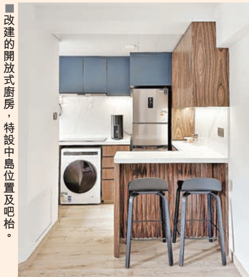
■ 改建的開放式廚房，特設中島位置及吧枱。