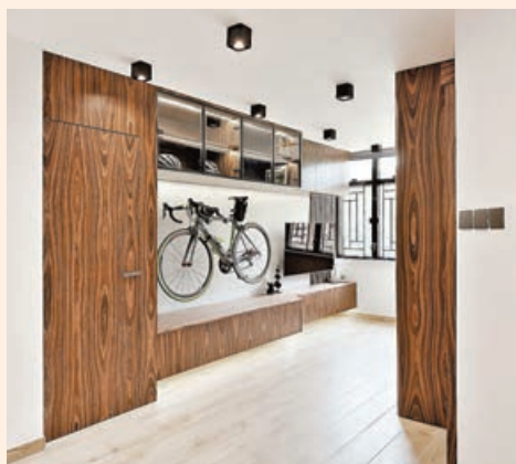
■ 客廳的木紋衣櫃採用深色木紋。