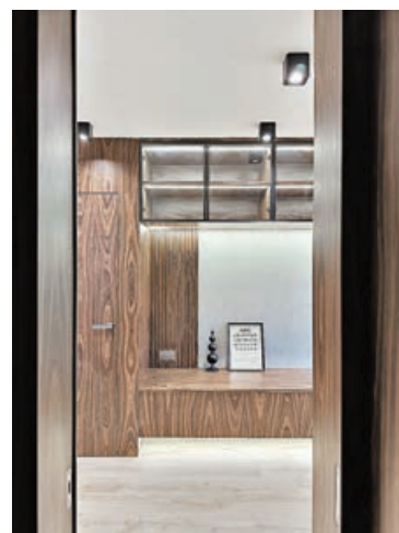
■ 裝飾櫃上方的玻璃飾櫃用作安放單車配件。