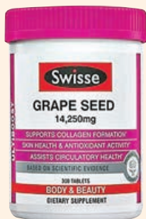
Swisse Ultiboost Grape Seed Supplement 229元

少有的 100%天然純素美白丸，加入白藜蘆醇及葡萄籽多酚，阻擋自由基傷害，抗氧化同時防皺，令肌膚重現光澤水潤。