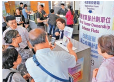
過往居屋推售，均吸引大批市民入表申請。

實用面積(呎)：278-475 單位數目：2,046 售價(萬元)：223-494