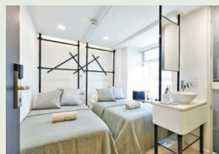
深水埗青年宿舍「仲學舍」提供最多84個宿位。

「仲學舍」項目由劉葉淑婉紀念慈善基金與華人置業集團合作推出。申請者必須是18至31歲香港永久性居民，一人申請總資產淨值不得多於39萬元，收入不得超過全港18至30歲就業人士每月就業收入第75百分值（目前水平是2.6萬元），申請人亦不得擁有任何本地住宅物業。