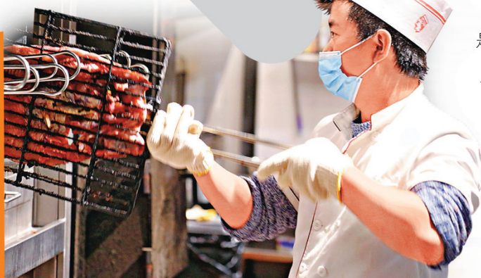
■周記留一手烤魚店的烤魚小哥。