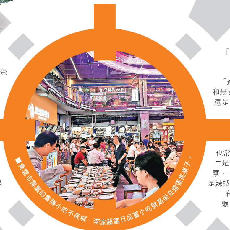
■青雲市集裏的貴陽小吃不夜城，李家超當日品嚐小吃就是坐在这張長桌子。