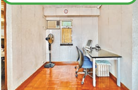
■大廳一角放置辦公桌。