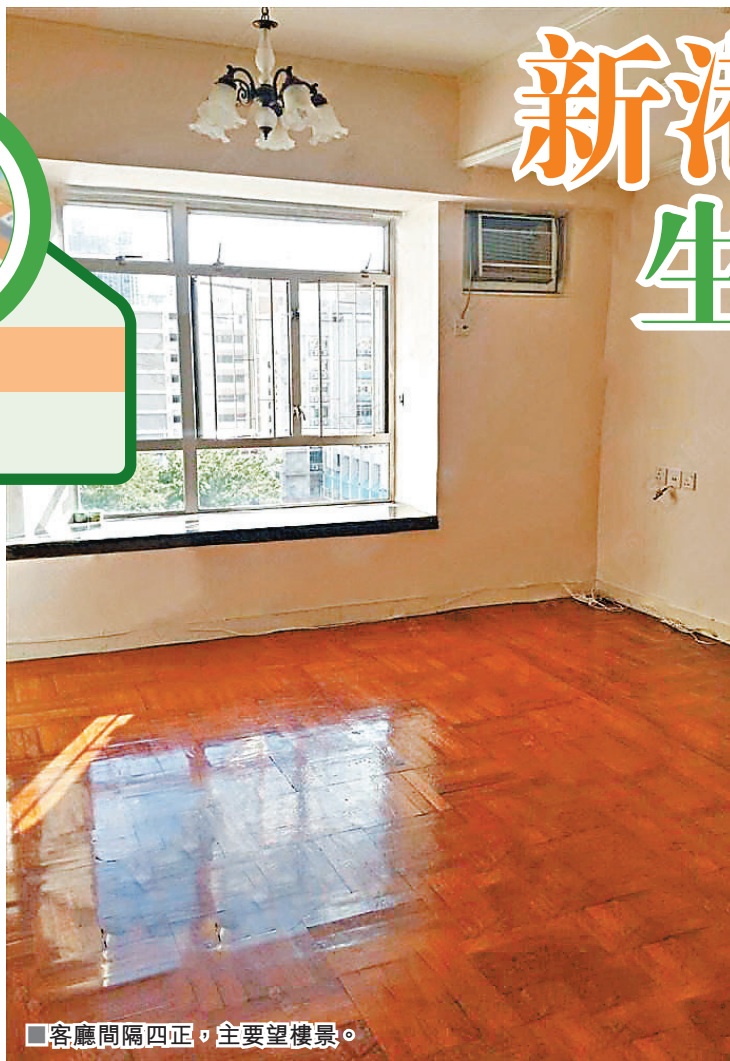
■客廳間隔四正，主要望樓景。