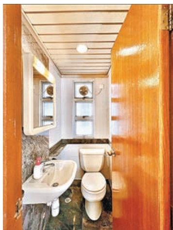
■洗手間裝有假天花，並有浴缸。