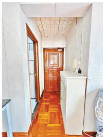
■臨近大門口長走廊可擺放鞋櫃。

新港城為馬鞍山區內規模最大私人住宅項目，由恒地發展。屋苑分為1至5期合共有20座樓宇，提供4,759個住宅單位，當中第1及第2期所有單位不設窗台。第1期：A和B座、第2期：C、D座、第3期：N、P、Q、R座、第4期：E、F、G、H、J、K、L、M座和第5期—海濤居：1、2、3、4座等。