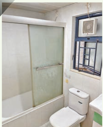
■洗手間浴缸特設玻璃趟門。