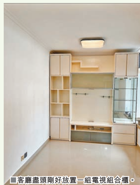
■客廳盡頭剛好放置一組電視組合櫃。