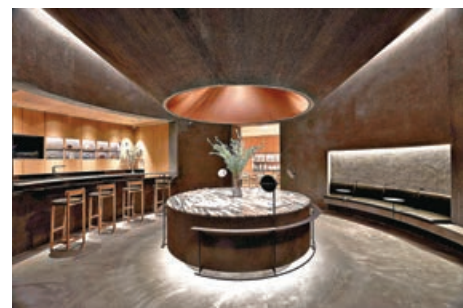
■中庭的設計以吸收天地正氣和太陽能量為主題。

養生體驗店劃分為「零售區」、「體驗區」及「諮詢區」三個主要區域，並巧妙地結合傳統中醫藥養生智慧和現代美學，營造出身臨其境的沉浸式感官之旅，為顧客帶來獨特體驗，並以淺灰色和天然木室內色調打造出寧靜、禪意的氛圍。「體驗區」設於體驗店的中央，空間結合方中帶圓的設計和古銅色的建築風格，中庭的設計以吸收天地正氣和太陽能量為主題，象徵養生之道追求的陰陽平衡、血氣循環，以達生生不息的境界。體驗區內設有一張以大理石打造的产品展示台，讓顧客探索不同養生產品的故事、製作過程和功效，並了解自己的身體狀況，找尋最適