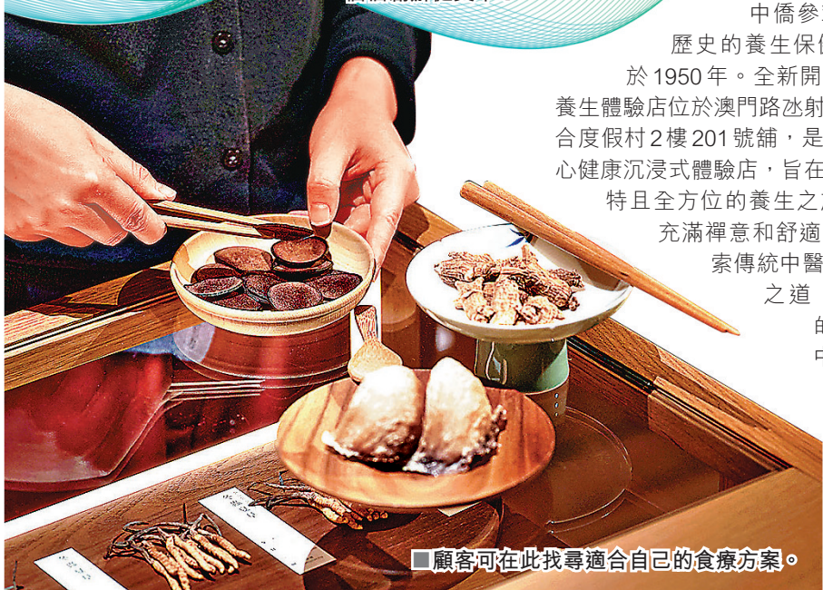
■顧客可在此找尋適合自己的食療方案。

至於「養生品品嘗區」則位於體驗區的另一側，養生顧問會在此根據每位顧客需要推薦合適的養生茶品，所有茶品都是根據中僑參茸的專屬配方調配而成，茶香、茶色、茶味和養生功效兼備。顧客可以在這個平靜的環境中，細意品嘗各式養生品，重新找回內心的寧靜和平靜的心境，同時聆聽內心深處的聲音，達到身心平衡的狀態。