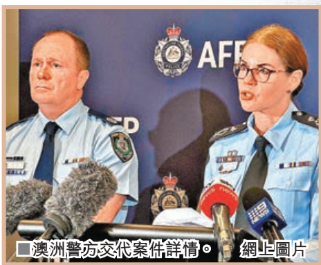
澳洲警方交代案件詳情。

澳洲發生一宗重大的兒童性侵案件，涉案男子被指在過去 15 年間，合共性侵 91 名兒童，當中更有拍片放上互聯網。澳洲警方透露，疑犯已被起訴超過 1,623 項控罪，最高刑罰為終身監禁。