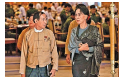
昂山素姬（右）與溫敏（左）仍要服刑多年。

另外，緬甸國防和安全委員會成員經集體討論後，決定為了確保國防軍總司令敏昂萊能夠圓滿完成職責，再次延長緊急狀態 6 個月。而承諾在今年 8 月之前舉行的選舉，則因多次出現暴力事件為由而推遲。