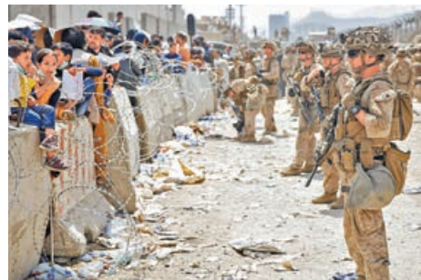
美軍 2021 年倉促從阿富汗撤軍，令民眾對美軍信心下跌。網上圖片

月 1 日到 22 日進行的民調顯示，對美軍「極具信心」、「頗具信心」的受訪者合計只有 60%，較去年調查時的 64% 進一步降低。